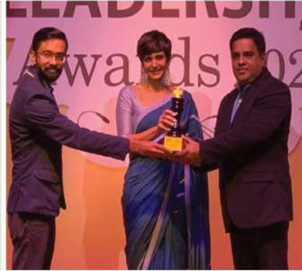
■ બોલીવુડ એક્ટ્રેસ મંદિરા બેદીના હસ્તે સન્માનિત