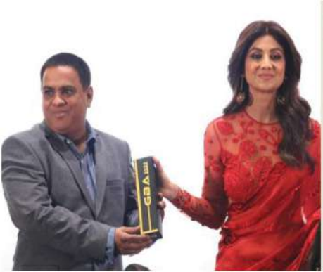
■ બોલીવુડ એક્ટ્રેસ શિલ્પા શેહીના હસ્તે સન્માનિત