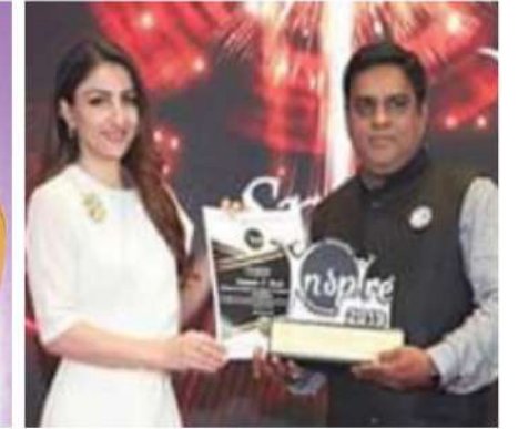
■ બોલીવુડ એક્ટ્રેસ સોહા અલીના હસ્તે સન્માનિત