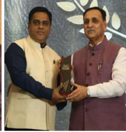
■ ગુજરાતના પૂર્વ મુખ્યમંત્રીશ્રી વિજયભાઈ રૂપાણીના હસ્તે એવોર્ડ સ્વીકારતા