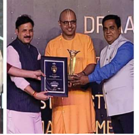
■ કેન્દ્રના મંત્રીશ્રી દેવુસિંહ ચૌહાણ અને મોટિવેશનલ સ્પિકર ગોરગોપાલદાસ હસ્તે એવોર્ડ સ્વીકારતા