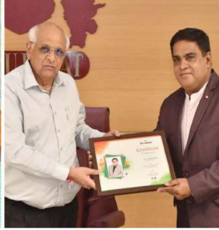
■ ગુજરાતના મુખ્યમંત્રીશ્રી ભૂપેન્દ્રભાઈ પટેલના હસ્તે સન્માનિત